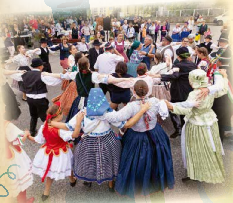
A menet több állomáson is megállt, így a táncosok és zenészek igazi szüreti fesztiválhangulatot teremtettek a falu terein, utcáin.