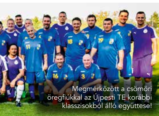
Megmérkőzött a csömöri öregfiúkkal az Újpesti TE korábbi klasszisokból álló együttese!