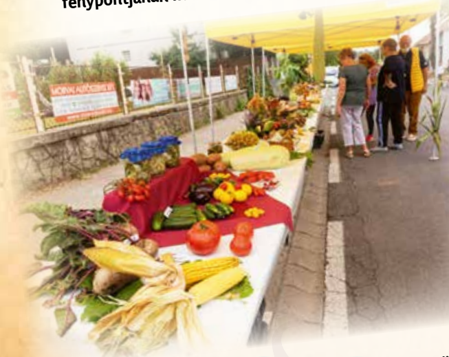
A látogatók a Turnovszky István Kertbarát Kör csodaszép terménykiállításában is gyönyörködhetnek, jóvoltukból helyben készült mustot is kóstolhattunk.