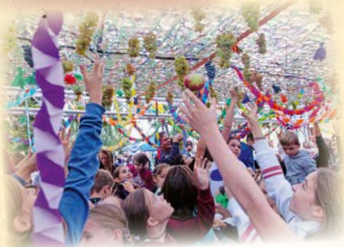
Természetesen a gyerekek számára az est fénypontjának minősülő szőlőlopás sem maradt el.