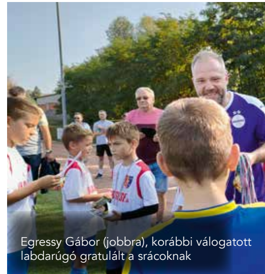
Egressy Gábor (jobbra), korábbi válogatott labdarúgó gratulált a srácoknak