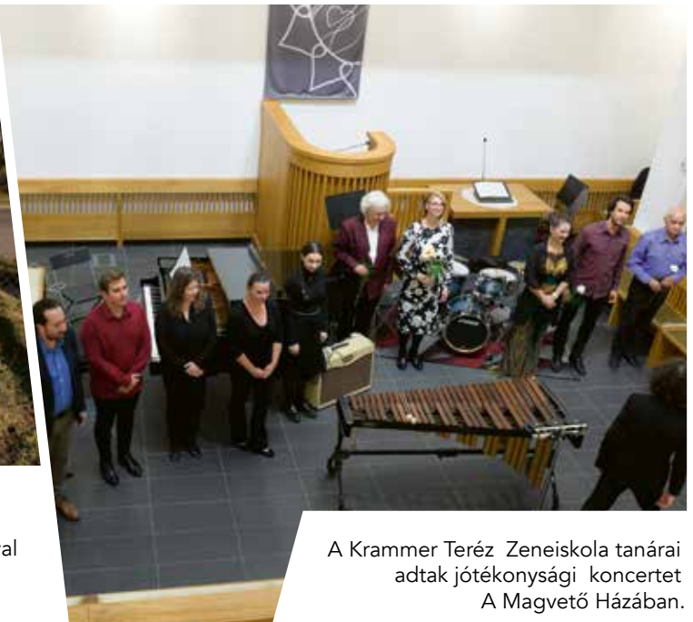
A Krammer Teréz Zeneiskola tanárai adtak jótékonysági koncertet A Magvető Házában.