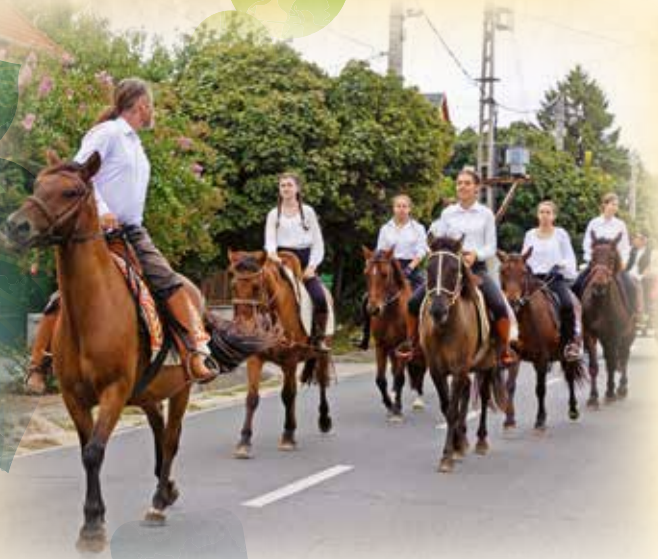
A lovas, lovaskocsis és népviseletes felvonulás igazi látványosság ilyenkor a faluban.

Szeptember utolsó napján tartották meg Csömör legnagyobb hagyományőrző eseményét, a Szüreti mulatságot.