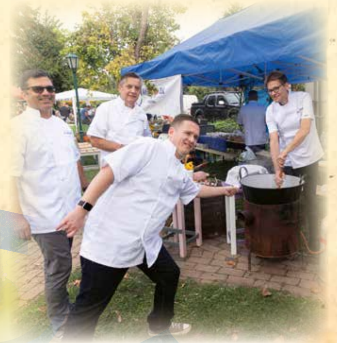
A lelkes főzőcsapatok már kora reggeltől sűrűgtek-forogtak, az ínycsiklandó finomságok pedig hamar kicsalogatták a látogatókat. A képen a főzőverseny győztesei láthatóak.