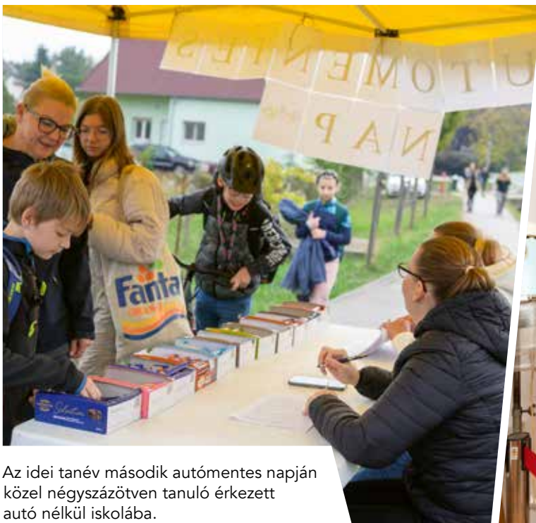
Az idei tanév második autómentes napján közel négyszázötven tanuló érkezett autó nélkül iskolába.