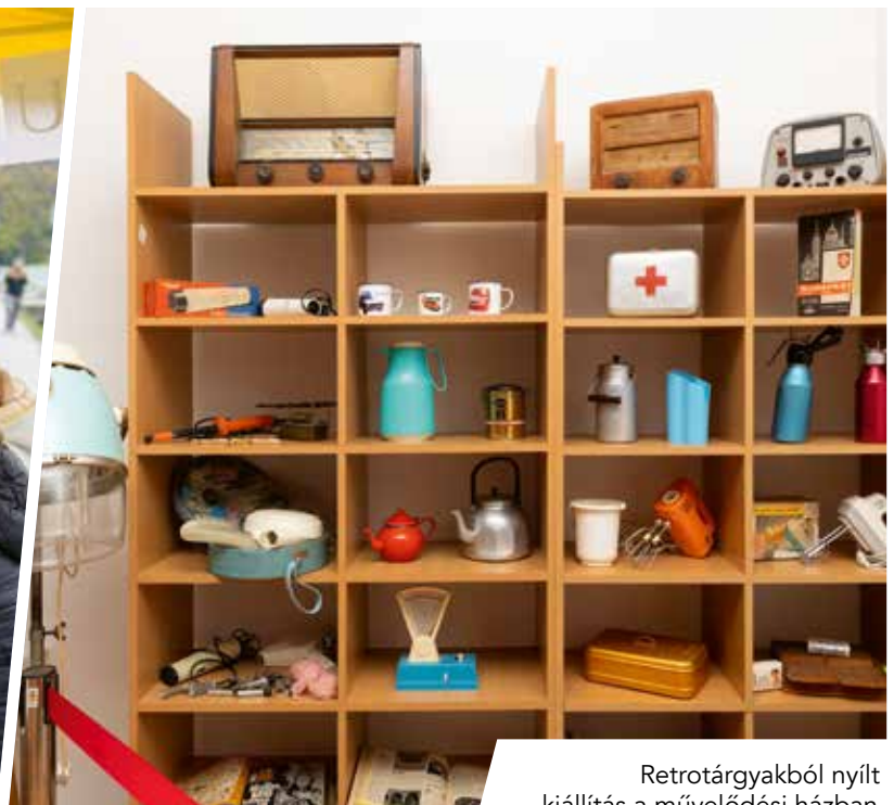
Retrotárgyakból nyílt kiállítás a művelődési házban.