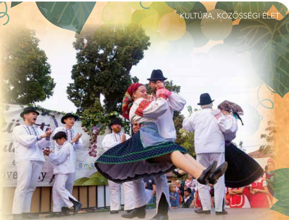
A Furmicska és a Csicsörke táncosai ismét fantasztikus előadással készültek.

Honfoglalók Vörösboros szürkemarha pörkölt vargányával, vasi dödöllén tálalva