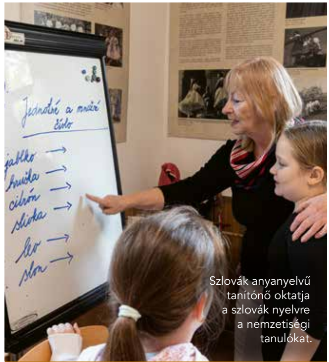
Szlovák anyanyelvű tanítónő oktatja a szlovák nyelvre a nemzetiségi tanulókat.