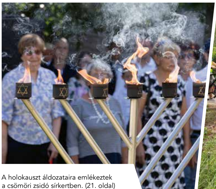
A holokauszt áldozataira emlékeztek a csömöri zsidó sírkertben. (21. oldal)