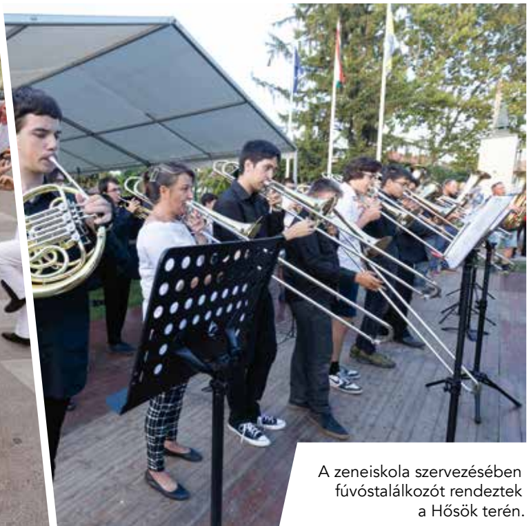
A zeneiskola szervezésében fúvóstadalalkozót rendeztek a Hősök terén.