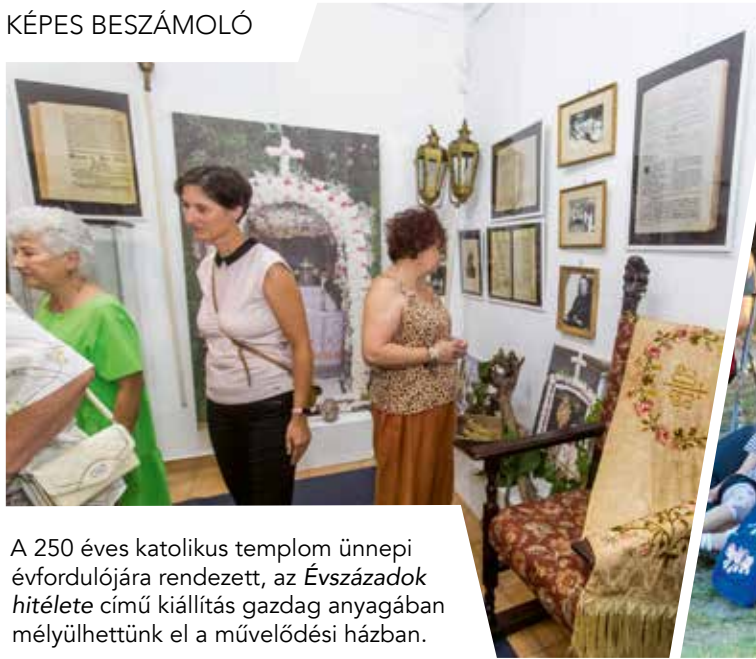
A 250 éves katolikus templom ünnepi évfordulójára rendezett, az Évszázadok hitélete című kiállítás gazdag anyagában mélyülhettünk el a művelődési házban.