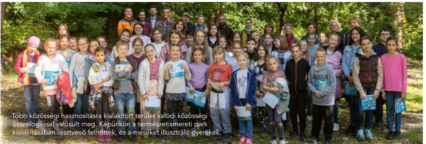
Több közösségi hasznosításra kialakított terület valódi közösségi összefogással valósult meg. Képünkön a természetismereti park kialakításában résztvevő felnőttek, és a meséket illusztráló gyerekek.

A közösségek a legnagyobb értékét jelentik településünknek. Éppen ezért tartjuk fontosnak, hogy minél több olyan területet alakítsunk ki, hozzájuk létre, mely alkalmas arra, hogy a lakosok, baráti társaságok, civil csoportok összegyűlhessenek és minőségi időt eltöltve lehessenek együtt. Több tízmillió forintos támogatást adtunk a pár éve megszületett és kibővített szlovák ház