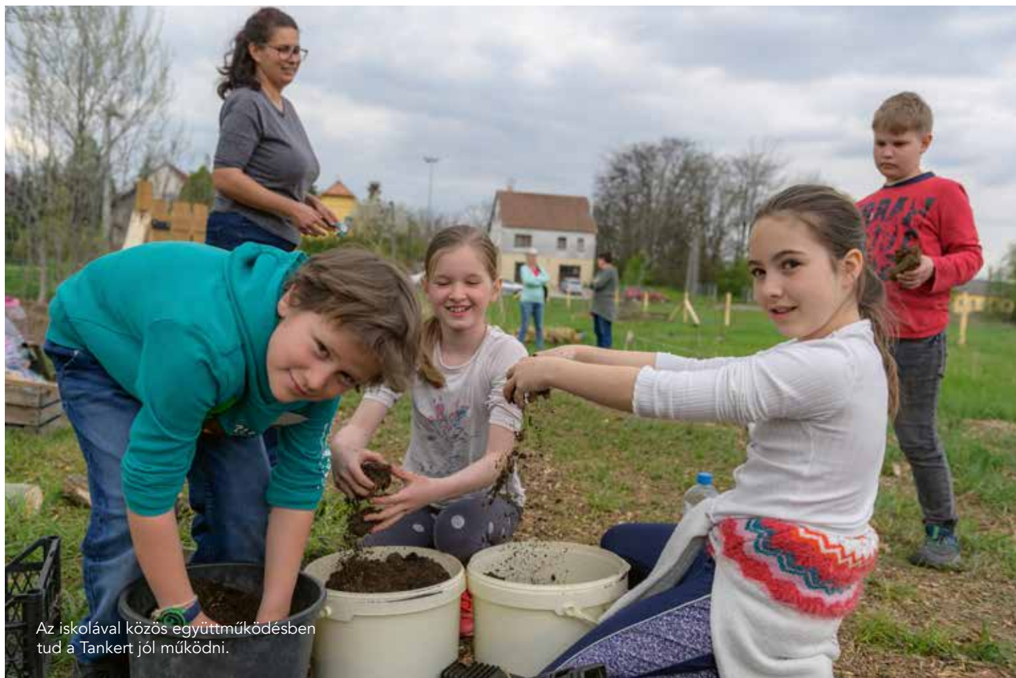
Az iskolával közös együttműködésben tud a Tankert jól működni.

te a képviselő-testületet, hogy korábban már döntöttek a 023/21 HRSZ-ú erdőrészlet közösség célú megvásárlásáról, ám idő közben egy másik vevő jelentkezése miatt az eladók az árat megemelték. A képviselő-testület – tekintettel Csömör erdeinek megóvására és megőrzésére, valamint az érintett erdőterületnek a falu közössége szempontjából is nagyon fontos elhelyezkedésére – úgy döntött, hogy a korábban felajánlott, a Nemzeti Földügyi Központ által meghatározott minimum vételi összeget