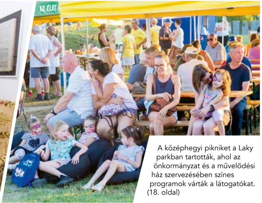
A középhegyi pikniket a Laky parkban tartották, ahol az önkormányzat és a művelődési ház szervezésében színes programok várták a látogatókat. (18. oldal)