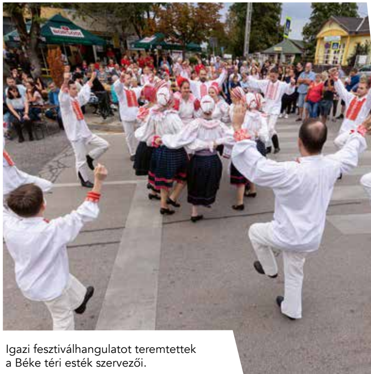
Igazi fesztiválhangulatot teremtettek a Béke téri esték szervezői.