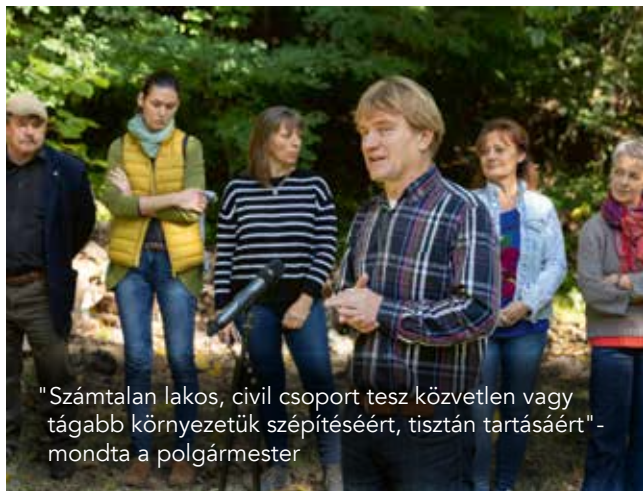
"Számptalan lakos, civil csoport tesz közvetlen vagy tágabb környezetük szépítéséért, tisztán tartásáért" - mondta a polgármester