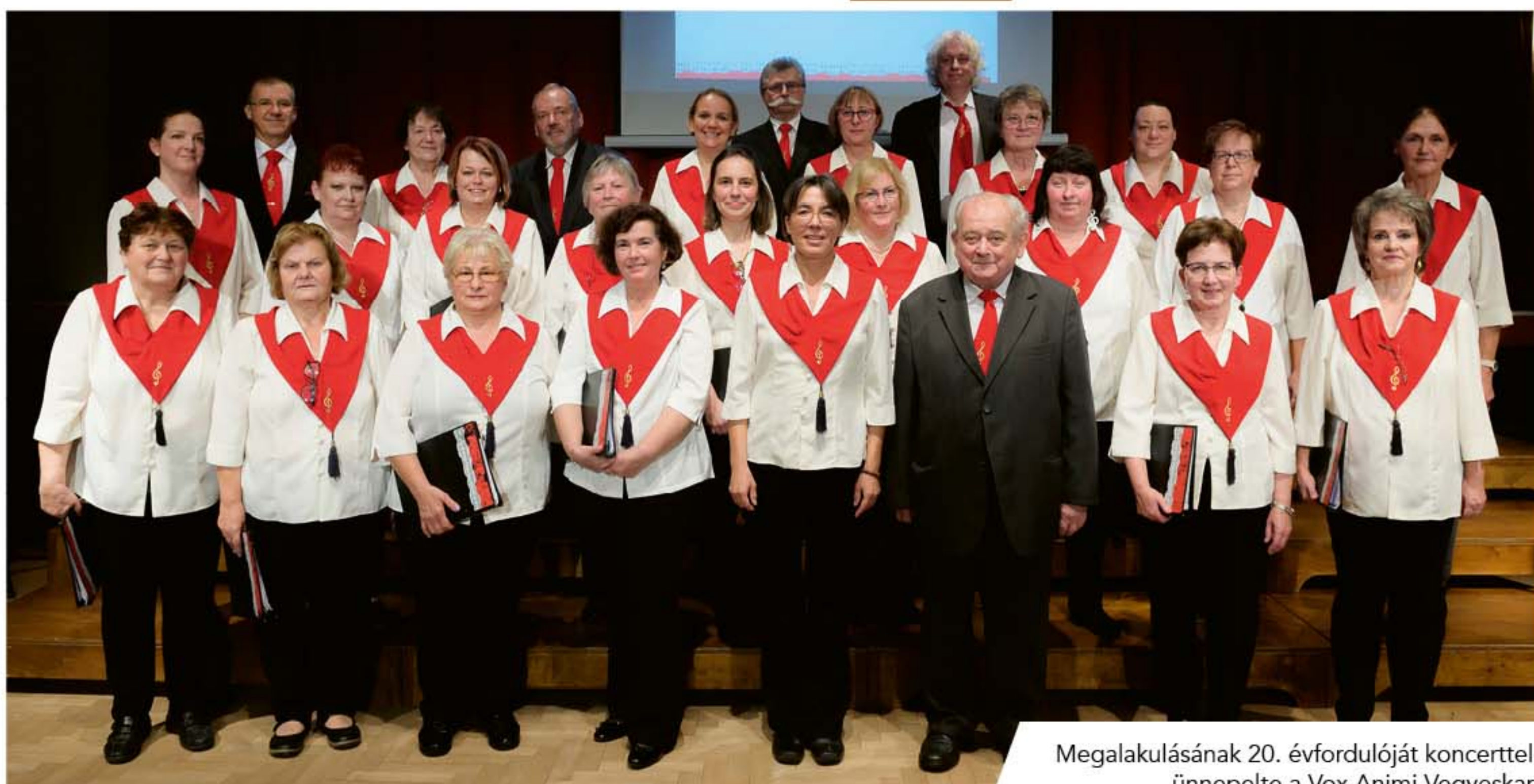
Megalakulásának 20. évfordulóját koncerttel ünnepelte a Vox Animi Vegyeskar.