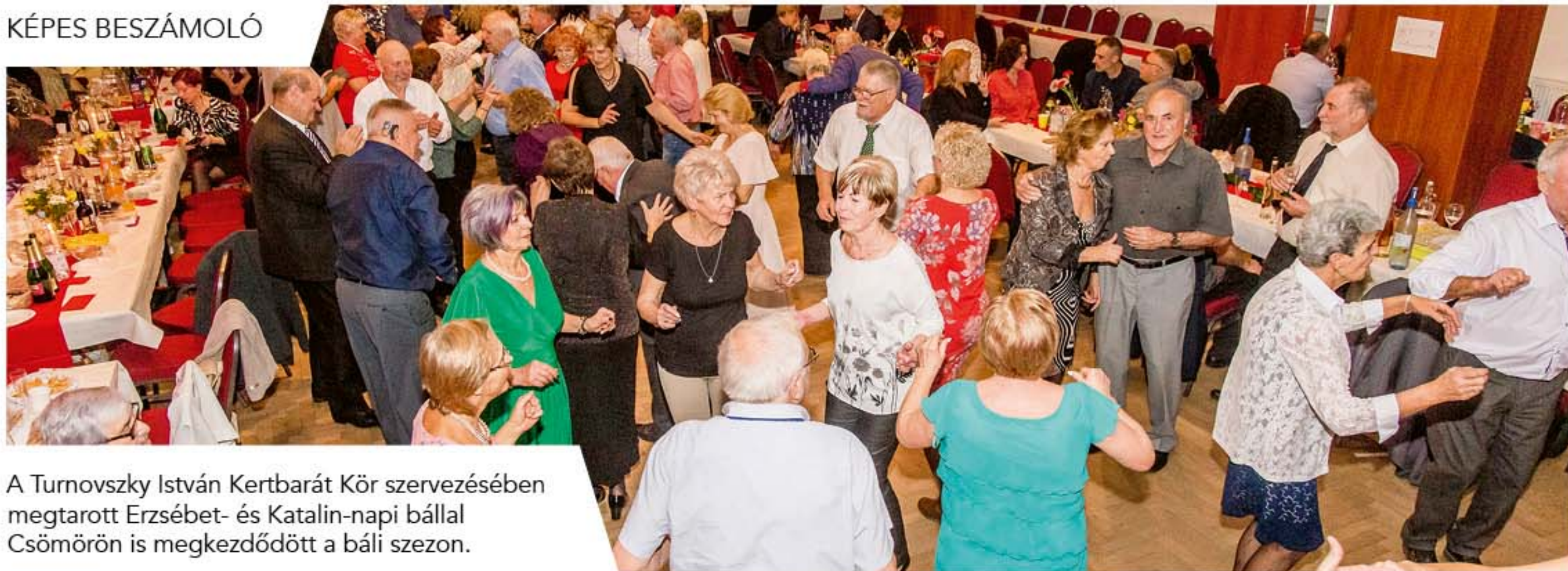
A Turnovszky István Kertbarát Kör szervezésében megtarott Erzsébet- és Katalin-napi bállal Csömörön is megkezdődött a báli szezon.