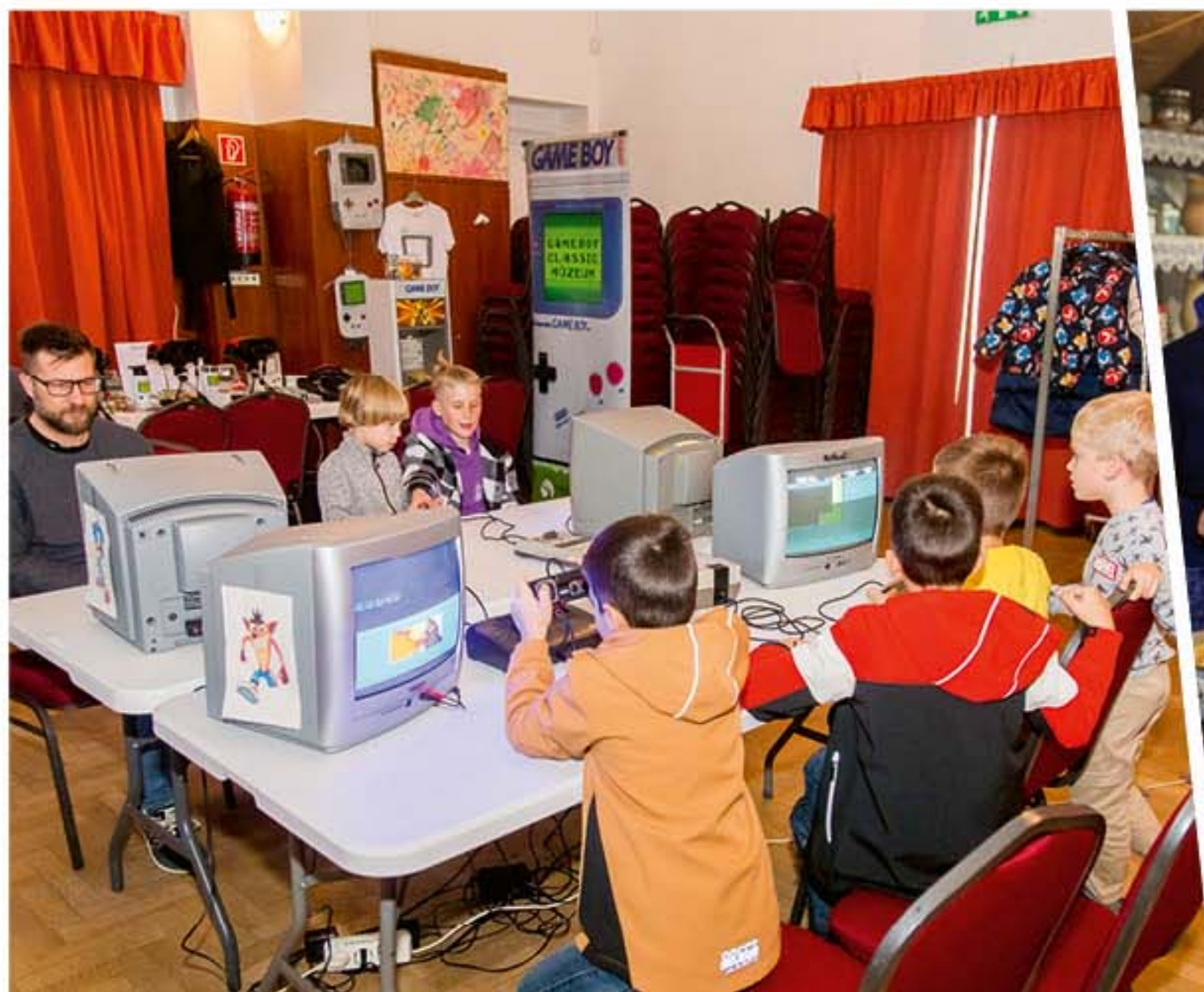
November első hétvégéje a retro hangulat jegyében telt, a művelődési házban és a Hősök terén igazi időutazásnak lehettünk tanúi.