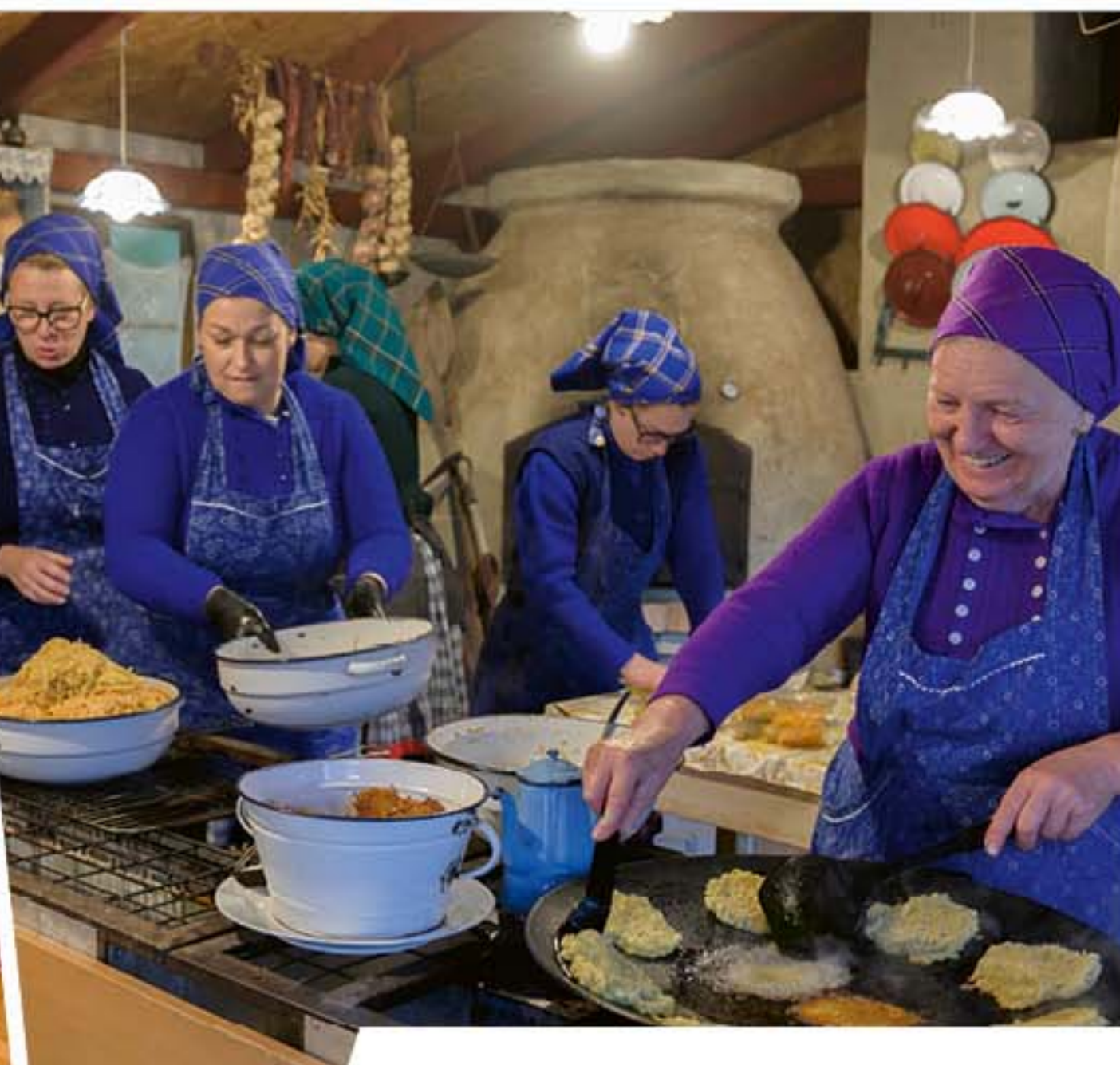
Hagyományos disznóvágást tartottak a Tót Hagyományaink Házában, ahol a helyben készült finomságokból kóstolhattunk is.