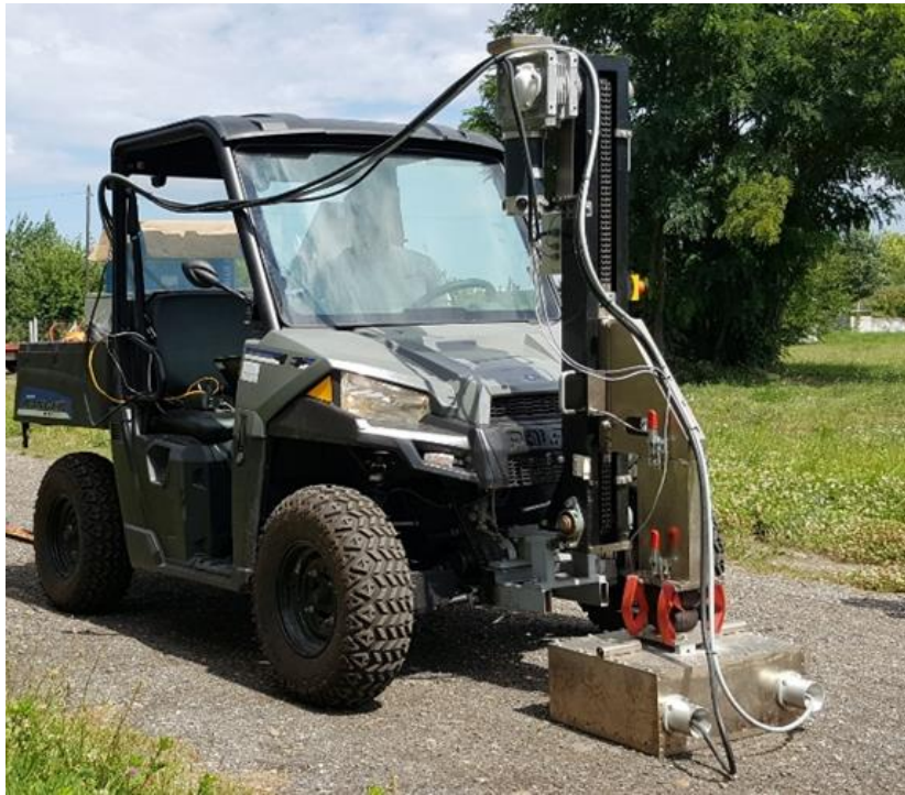
Nehezen megközelíthető helyeken alkalmazott vibroszeiz jelforrás

A nehezen megközelíthető helyeken a jelgerjesztést kisebb, az alábbi fényképen látható vibroszeiz jelforrással végezzük. Ennek az elektromos meghajtású gépnek a környezetre gyakorolt hatása elhanyagolható.