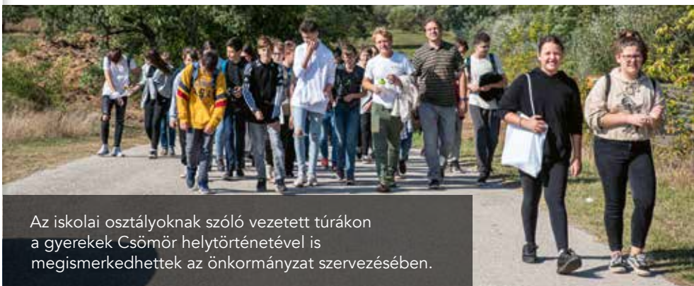
Az iskolai osztályoknak szóló vezetett túrákon a gyerekek Csömör helytörténetével is megismerkedhettek az önkormányzat szervezésében.

hetőségeinkhez mérten történő maximális támogatása.