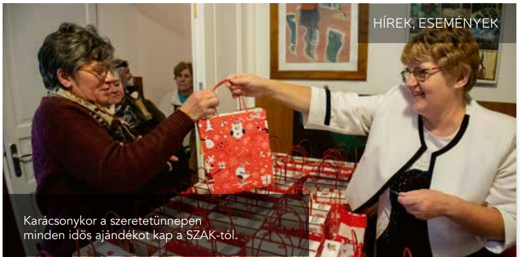
Karácsonykor a szeretetünnepen minden idős ajándékot kap a SZAK-tól.

Szociális hálónk nagyon kiterjedt, igyekszünk jelen lenni a nehezebb körülmények