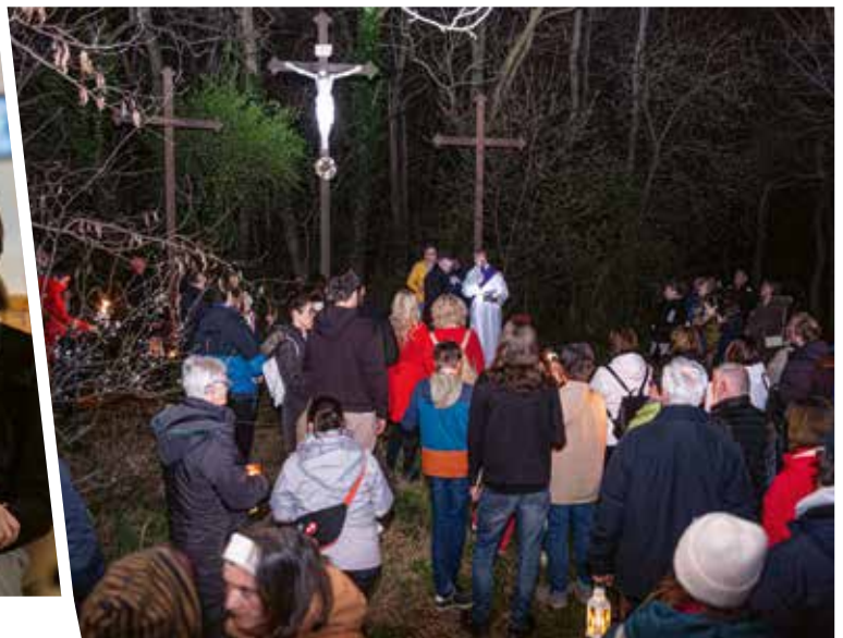
A Via Veritatis Alapítvány szervezésében, és a csömöri Kulturális Közalapítvány támogatásával fátylós keresztút indult március 22-én a Kálváriára.